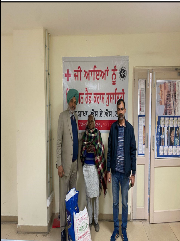
Ration kits donated to poor and needy ones by District Red Cross SAS Nagar, Mohali,