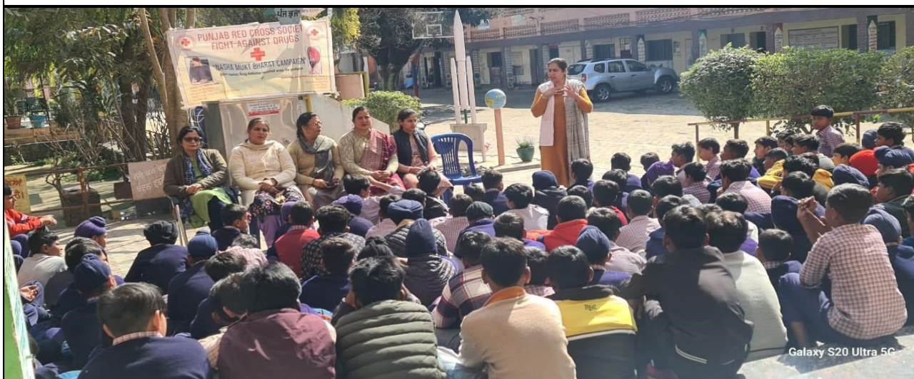
Indian Red Cross Society, Punjab State IRCA Integrated Rehabilitation Center for Addicts, Gurdaspur organized an anti-drug awareness camp under "Nasha Mukat Bharat Abhiyaan" at Government Sr. Sec. School for boys, Fatehgarh