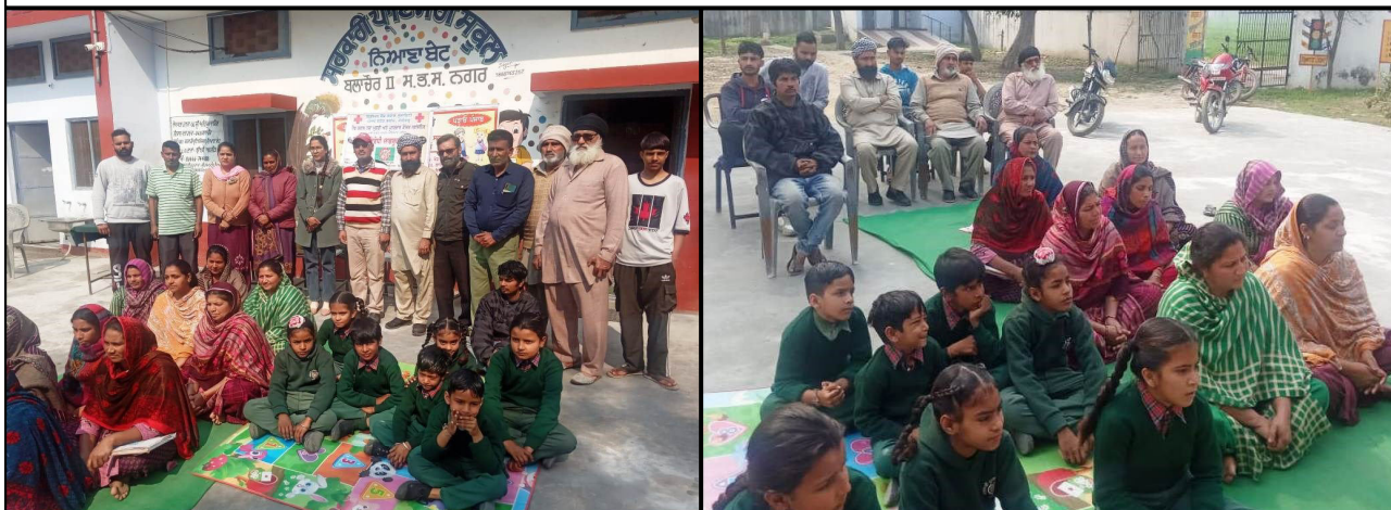
Indian Red Cross Society, Punjab State IRCA Drug De-Addiction and Rehabilitation Center Nawanshahr,Punjab organized an awareness camp at, Govt. Primary School Niana Bet (Balachaur) under "Nasha Mukat Bharat Abhiyaan".