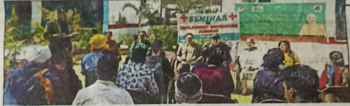
युवाओं को हुनर की जानकारी देते अधिकारी।