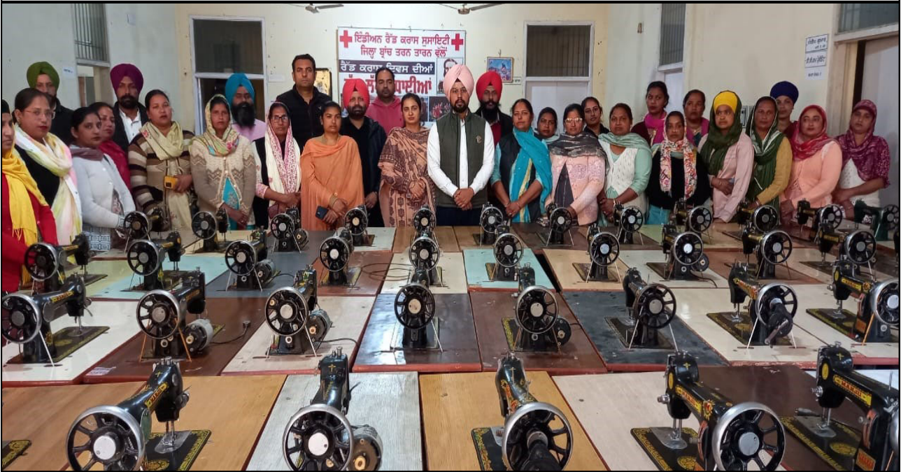
Indian Red Cross Society, Punjab district Taran-Taran function organized a function in which 50 Umbrella Sewing machines were distributed to the needy. These sewing machines were distributed in the presence of Deputy Commissioner cum President of district Red Cross Branch and SDM of Taran-Taran district.