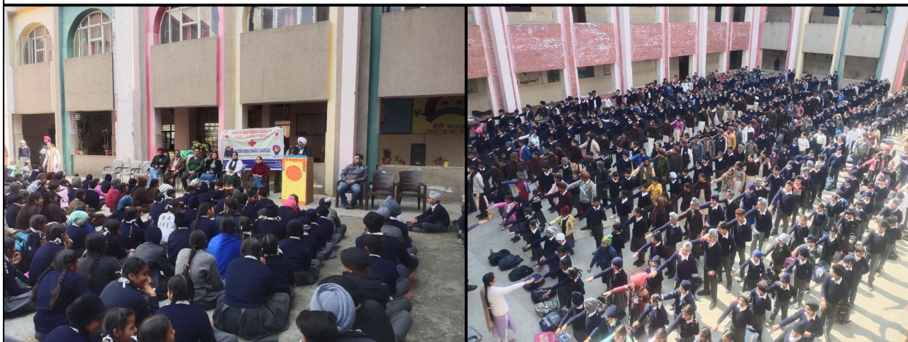
An awareness seminar against drug addiction was organised by Indian Red Cross Society, Punjab State Drug De-addiction Centre Gurdaspur( Punjab) at Government Adarsh Sr Sec school, Kot Dhandal, GURDASPUR