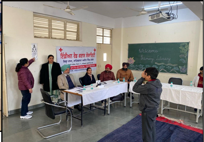
Medical checkup Camp at KV Mohali