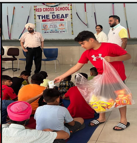
Distribution of food packet by Red Cross Team, Jalandhar