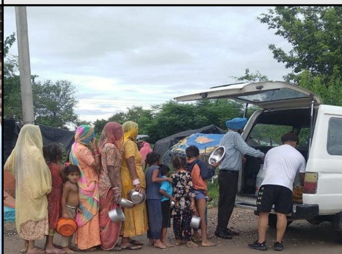
Distribution of food packet by Red Cross Team, Ropar