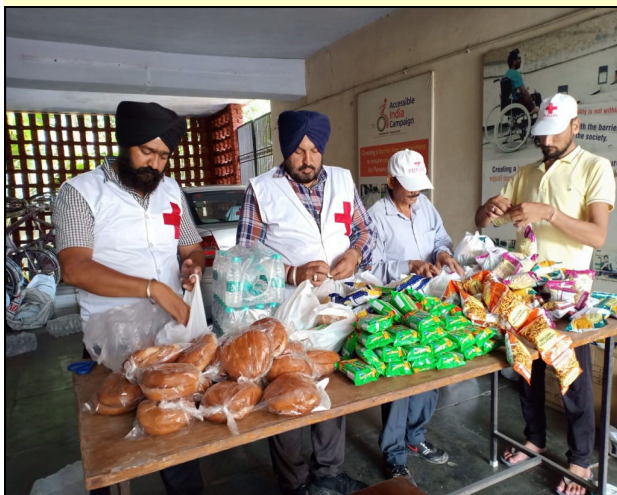
Packaging of food packet by Red Cross Team, Patiala