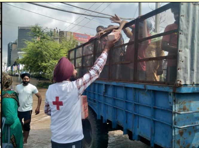
Distribution of food packet by Red Cross Team, Patiala