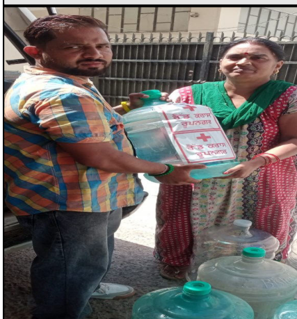
Distribution of water bottles by Red Cross Team, Ropar