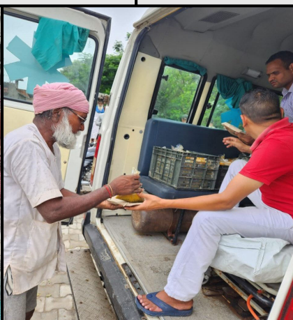
Distribution of food packet by Red Cross Team, Ferozpur