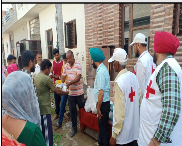
Distribution of food packet by Red Cross Team, Patiala